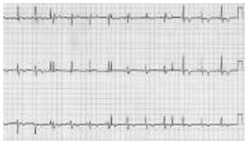
图 3-10-6 第十八天