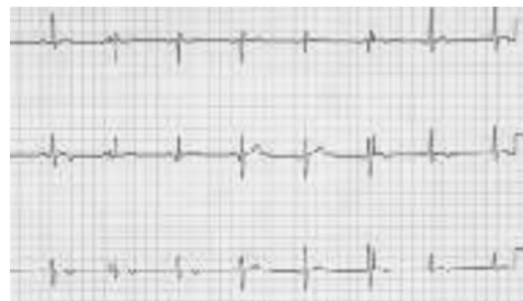
图 3-10-7 三个月后