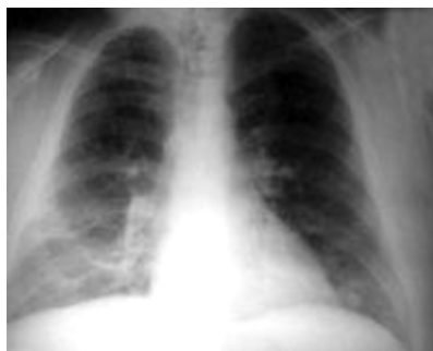
图 3-10-2 渗出性心包炎的肺部 X 线正位片

(二) X 线检查 对渗出性心包炎有一定诊断价值，当心包积液 >250\text{ml} 时，可出现心影增大，呈水滴状或烧瓶状，心影随体位改变而移动，心脏搏动减弱或消失，而肺部无明显充血现象（图 3-10-2, 3）。