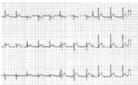
图 3-10-4 发病第一天