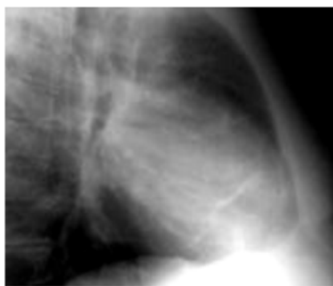
图 3-10-3 渗出性心包炎的肺部 X 线侧位片